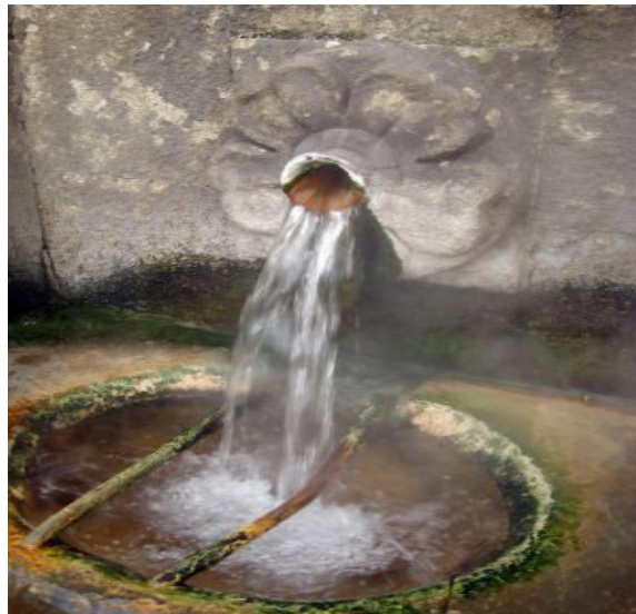
Fonte das Burgas. Ourense

Universidade de Vigo (ES), Subita S.L. (ES), Ingeo Consultoría Geotérmica (ES), Xeoquis S.L. (ES).